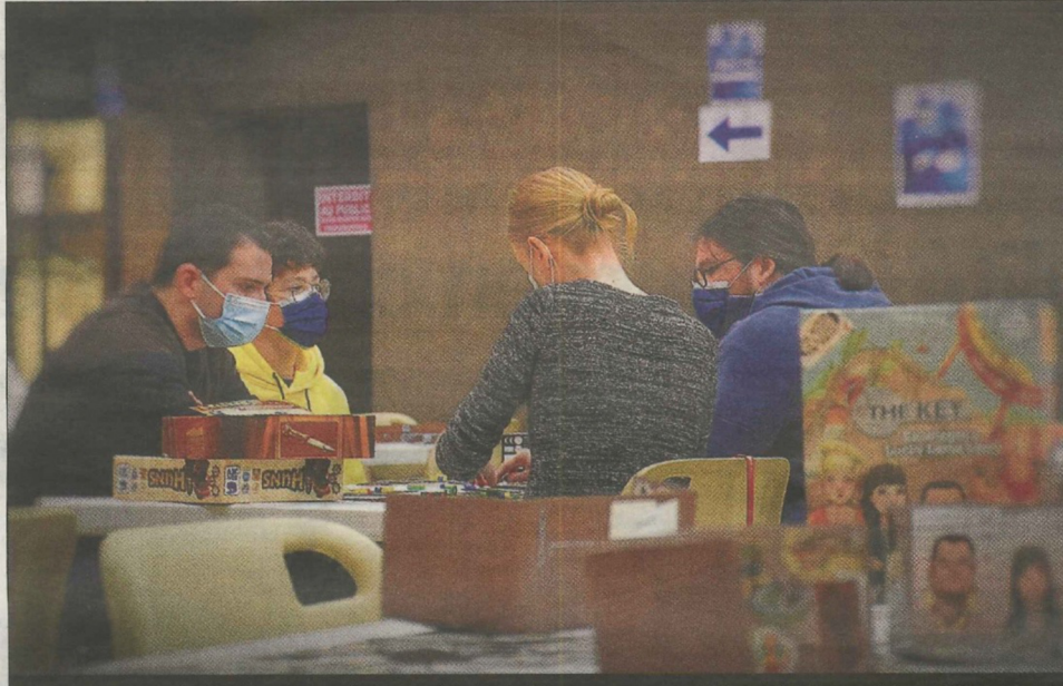
AFFLUENCE. La 15 e édition des 24 heures du jeu a attiré plus de 120 personnes, contre 85 lors de la 14 e , organisée en 2020.

Entre le samedi 14 heures et le dimanche 18 heures (car les 24 heures du jeu durent en réalité 28 heures), « la salle n'a jamais été vide », jubilent