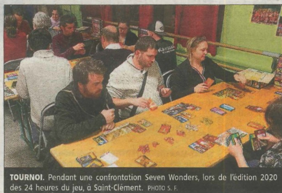
TOURNOI. Pendant une confrontation Seven Wonders, lors de l'édition 2020 des 24 heures du jeu, à Saint-Clément.

Pour la première fois, ces 24 heures du jeu auront lieu à la salle des fêtes de Saint-Clément. Les organisateurs ont reçu une quarantaine de jeux de société