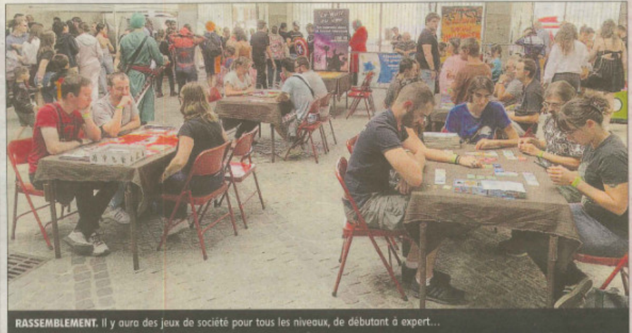
RASSEMBLEMENT. Il y aura des jeux de société pour tous les niveaux, de débutant à expert...

Une centaine de jeux de société seront à disposition à partir de samedi à 15 heures jusqu'à dimanche vers 18 heures.